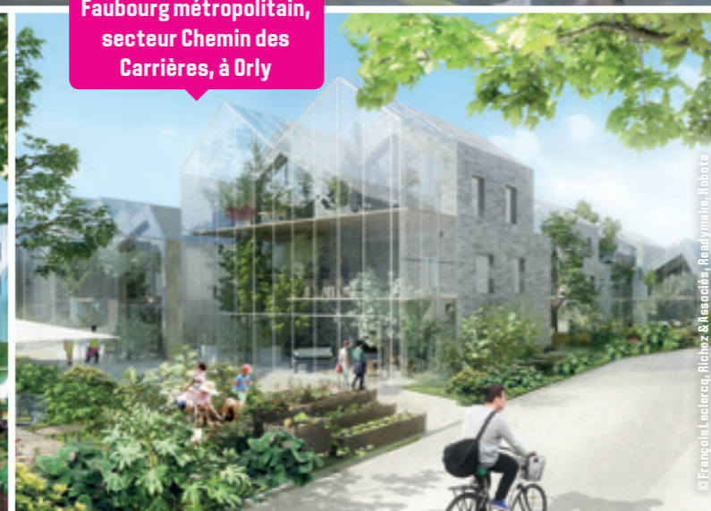
Faubourg métropolitain, secteur Chemin des Carrières, à Orly

© François Leclercq, Richez & Associés, Ready make, Rabata