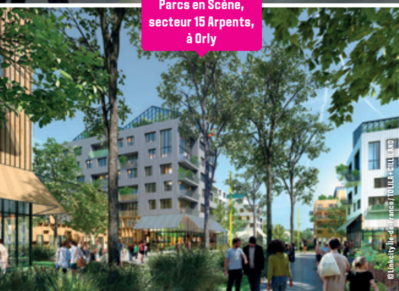
Parcs en Scène, secteur 15 Arpents, à Orly